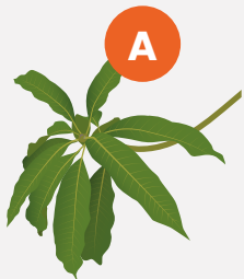
Ramas y hojas

¿Dónde almacenan los árboles el CO 2 capturado?